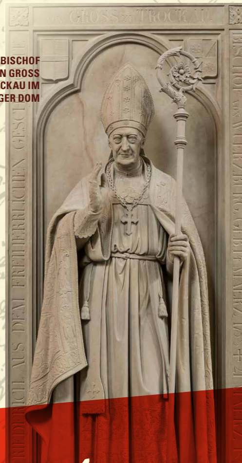
EPITAPH FÜR BISCHOF FRIEDRICH VON GROSS ZU TROCKAU IM WÜRZBURGER DOM