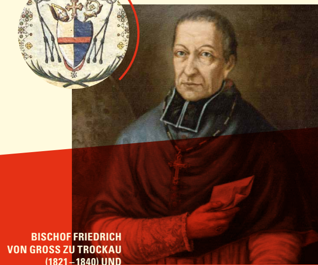
BISCHOF FRIEDRICH VON GROSS ZU TROCKAU (1821–1840) UND BISCHOFSWAPPEN