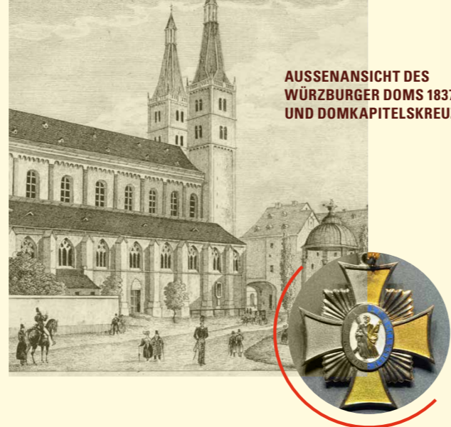
AUSSENANSICHT DES WÜRZBURGER DOMS 1837 UND DOMKAPITELSKREUZ

Das Hochstift Würzburg, mit der Verbindung geistlicher und weltlicher Gewalt in der Hand des Bischofs, war in der Säkularisation von 1802/03 untergegangen. Auch das adelige Domkapitel wurde aufgelöst. 1808 verstarb der letzte Würzburger Fürstbischof Georg Karl von Fechenbach; der Bischofsstuhl blieb vakant. In den Jahren der politischen Umwälzungen der napoleonischen Zeit zerfiel das alte Bistum Würzburg. Die knapp zwei Jahrzehnte zwischen 1802 und 1821 brachten einen einmaligen Bruch in der Geschichte des Bistums Würzburg mit sich.